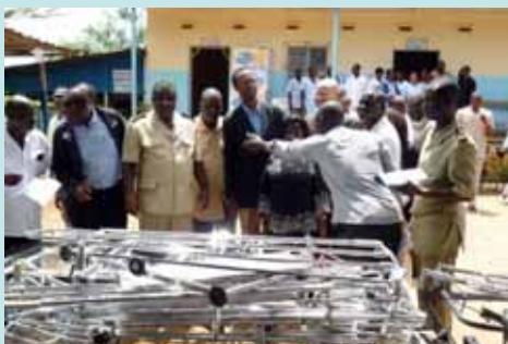
Visite des équipements par les autorités de la Région de Lakota