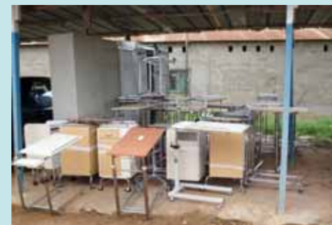
Vue du mobilier médical offert par l'AME international