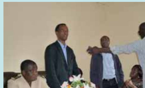
Allocution du Président de l'AME International