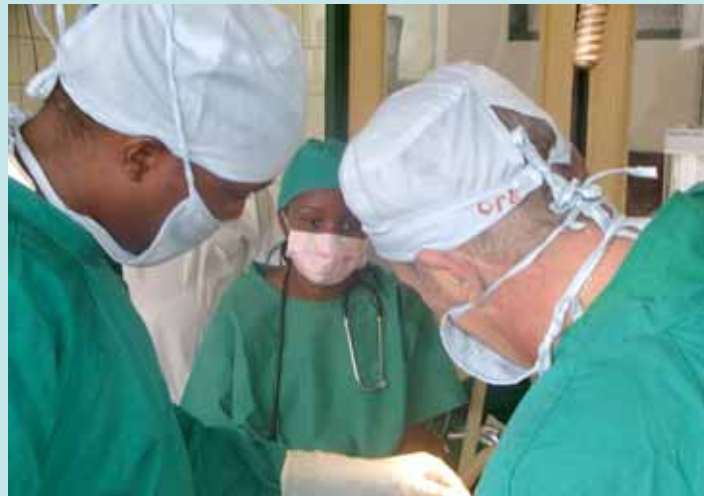
Séance de formation des médecins locaux au bloc opératoire