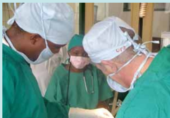
Chirurgien maxillo-facial en cours d'intervention