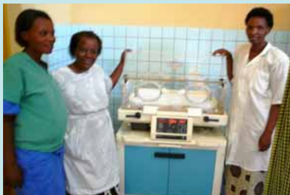
Couveuse acheminée par AME International