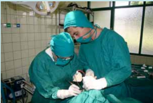
Chirurgiens ORL en cours d'intervention