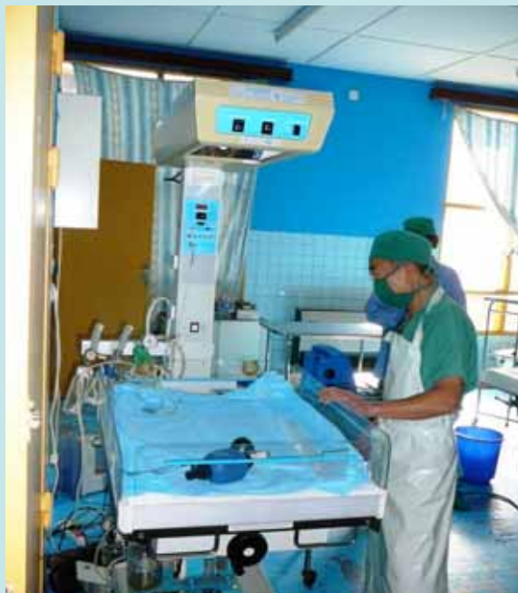
Table de Réanimation pédiatrique acheminée par AME International