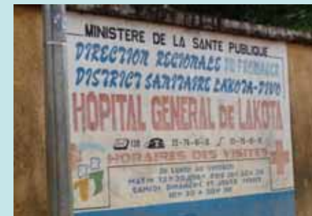
Arrivée à l'hôpital de Lakota