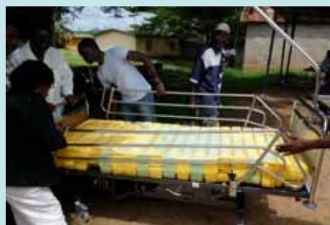
Montage d'un lit médical