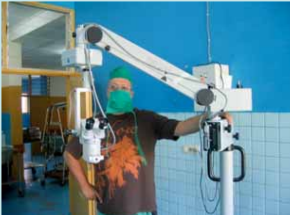
Installation du microscope ophtalmo acheminé par AME à l'hôpital de Ruhengeri