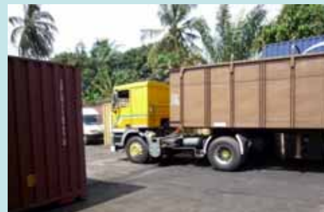
Départ du matériel du container vers l'hôpital de Lakota