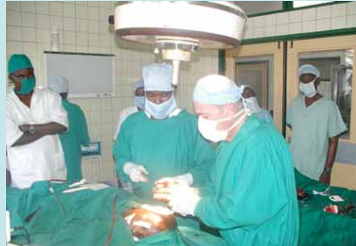
Séance de formation des médecins locaux au bloc opératoire