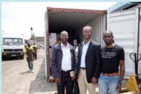
Réception du matériel au Port d'Abidjan