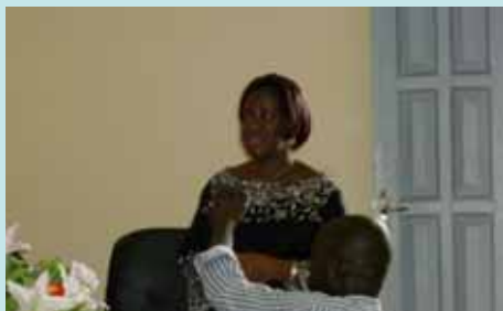
Mot de bienvenue de Madame le Maire de Lakota