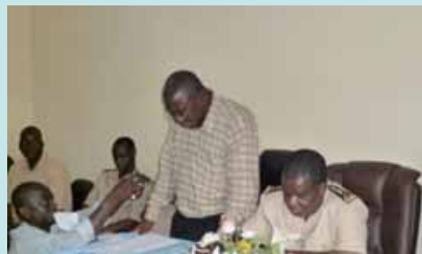
Allocution du Directeur de l'hôpital Lakota en présence du Préfet