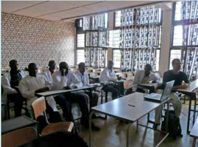
Séance de formation des médecins locaux