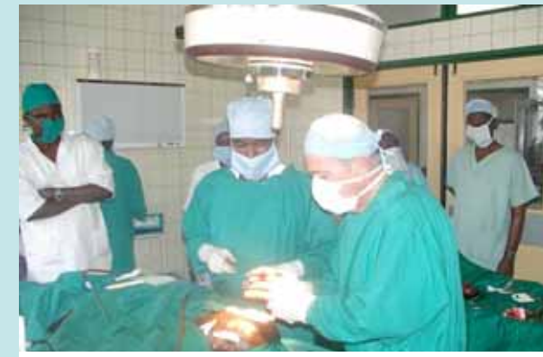
Chirurgien maxillo-facial en cours d'intervention